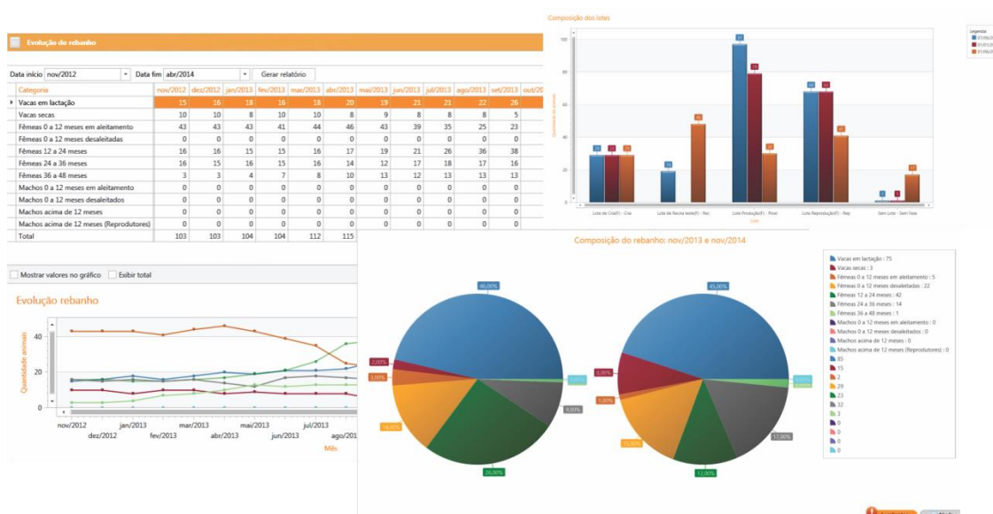
Figura 2 – Tabela e gráficos visualizados no software.

Com o sistema Esteio você gerencia seu rebanho, aumenta a eficiência e evita prejuízos. Avaliando suas informações através de tabelas e gráficos dinâmicos que podem ser configurados de acordo com a sua forma de trabalho: